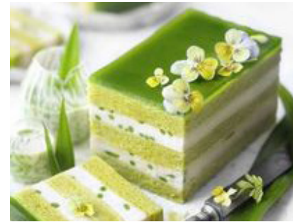
Tarte aux pommes